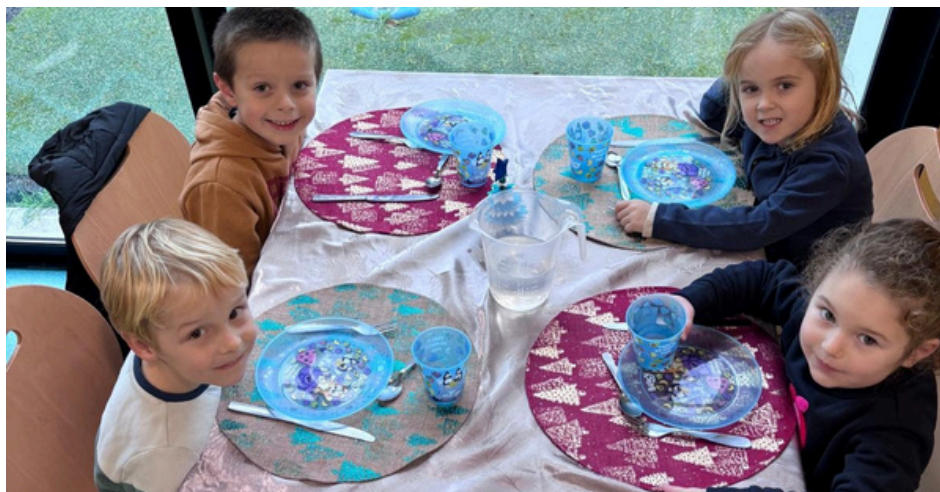
TABLE D'HONNEUR / TUTORAT