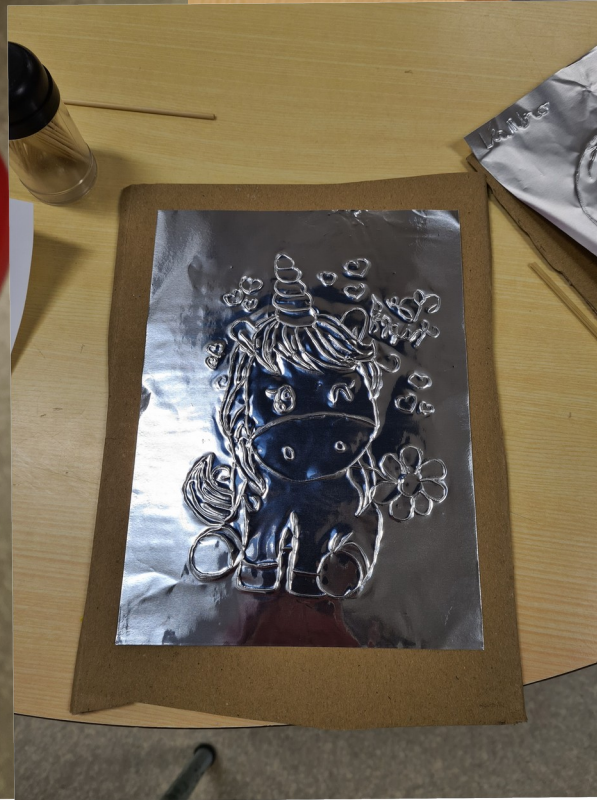
Technique Du métal a repousser